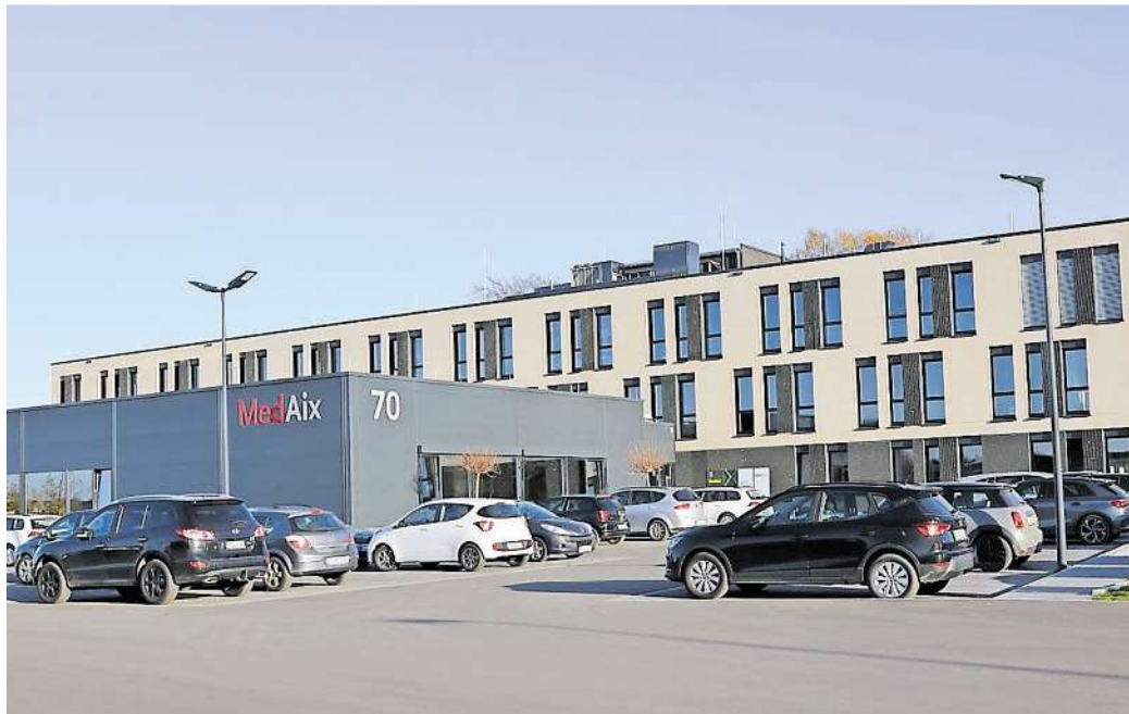
Moderne Fassade, modernes Innenleben - der Hauptmieter im neuen Haus lädt morgen zur Eröffnungsfeier.